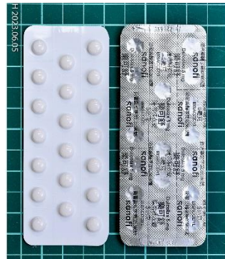
樂可舒腸溶糖衣錠 5 毫克