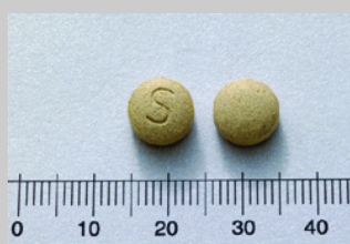
散肚秘錠 154 毫克