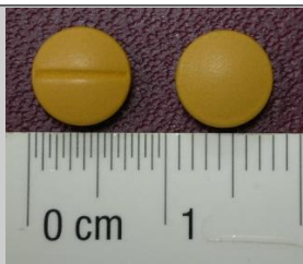
便通樂膜衣錠 20 毫克