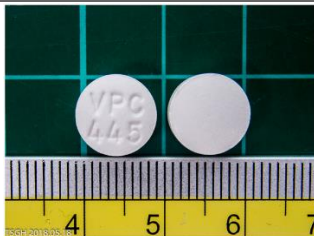
氧化鎂錠 250 毫克