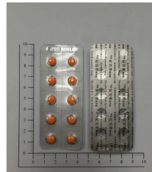
秘瀉樂腸溶膜衣錠 5 毫克