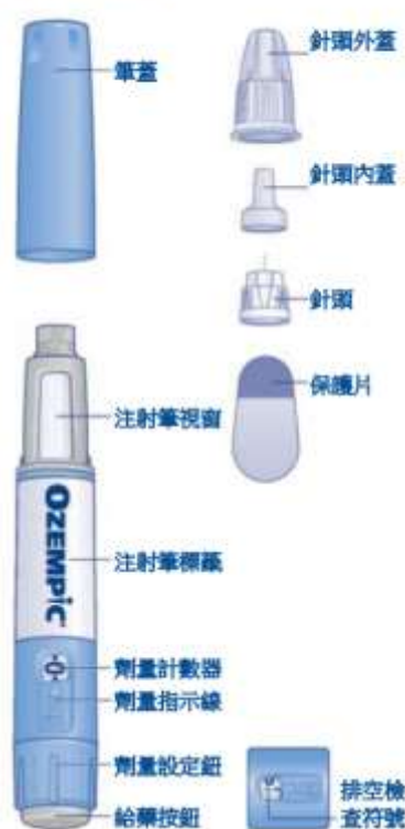
胰妥讚® 預充填注射筆及針頭 (範例圖)

以筆針形態讓這支針劑優雅又不失其功效，有可以查看注射液劑是否無色澄清的視窗，也有可以輕易調節處方劑量的視窗，是注射筆針發展到現行十分成熟的樣貌，使用上完全不用擔心，只要依照指示使用，每週皮下注射施打乙次，於腹部、大腿或上臂交替改變注射部位，並確實依醫囑使用，記得清楚標記施打日期，如果不小心錯過施打時間，可以在5天內補施打，實在超過5天才想起來，應該直接等到下一個循環，不應再補打，用藥期間仍然應該定期監測自己的血糖數值，好的良方，更需要搭配有效的監測，才會一步步接近治療目標。